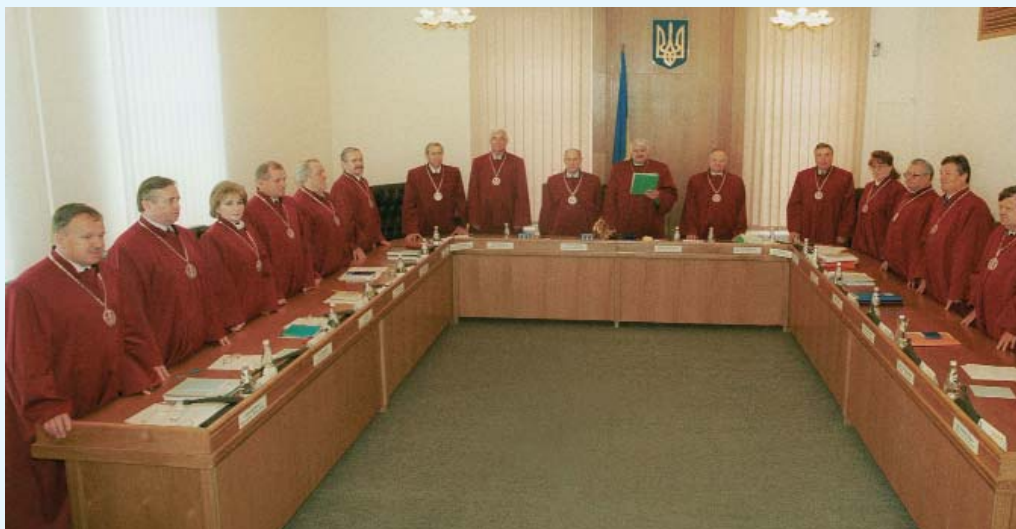
Пленарне засідання Конституційного Суду України у будинку по вул. Банковій, 5/7

Були також отримані звернення (листи) з питань, що не належать до сфери конституційної юрисдикції: від депутатів рад усіх рівнів — 284, громадян — 26229, юридичних осіб — 2532. У встановленому порядку цим заявникам надавалися роз'яснення, які базувалися, зокрема, на тому, що вирішення питань, пов'язаних із встановленням та дослідженням фактичних обставин справи, оцінкою законності і обґрунтованості рішень, прийнятих судами загальної юрисдикції, іншими органами державної влади, не віднесено до компетенції Конституційного Суду. Відповідно до чинного законодавства Суд не може відкривати за власною ініціативою конституційне провадження у справах з актуальних питань, що виникають у суспільстві та державі, а отже, не може приймати до розгляду такі справи.