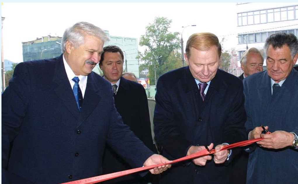
Урочисте відкриття 18 жовтня 2001 року нового приміщення Конституційного Суду України по вул. Жиланівській, 14 (зліва направо — Голова Конституційного Суду України Скомороха В.Є., Президент України Кучма Л.Д., Київський міський голова Омельченко О.О.)

У справах цієї категорії Суд прийняв 30 рішень, з них 20 рішень — за поданнями народних депутатів України, 8 — за поданнями Президента України, 2 — за поданнями Верховного Суду України.