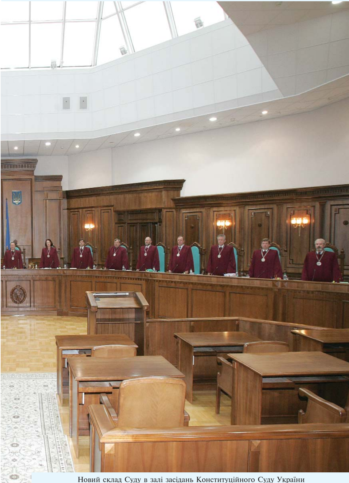
Новий склад Суду в залі засідань Конституційного Суду України