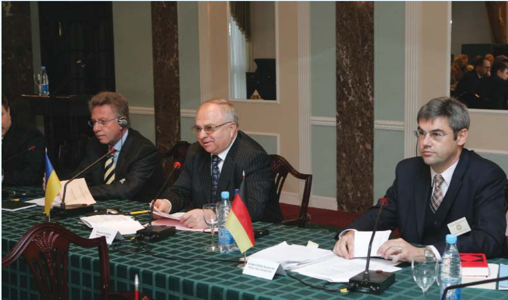
Голова Конституційного Суду України Селівон М.Ф. (у центрі) на Міжнародній конференції «Вплив практики Європейського суду з прав людини на національне конституційне судочинство» (13–16 жовтня 2005 року)

За роки своєї діяльності Конституційний Суд України розв'язав низку конституційно-правових проблем — вони відомі. Нагадаю, що найбільш резонансними були рішення у справах про внесення змін до Конституції України, позачерговий розгляд законопроектів, несумісність депутатського мандата з іншими видами діяльності, застосування української мови, безоплатність медичної допомоги у державних і комунальних закладах охорони здоров'я, доступність і безоплатність дошкільної, повної загальної середньої, професійно-технічної, вищої освіти в державних і комунальних навчальних закладах, оподаткування підприємств з іноземними інвестиціями, запити народних депутатів України, незалежність суддів як складову їхнього статусу, право на пільги, зворотну дію в часі законів та інших нормативно-правових актів, смертну кару, прописку тощо.