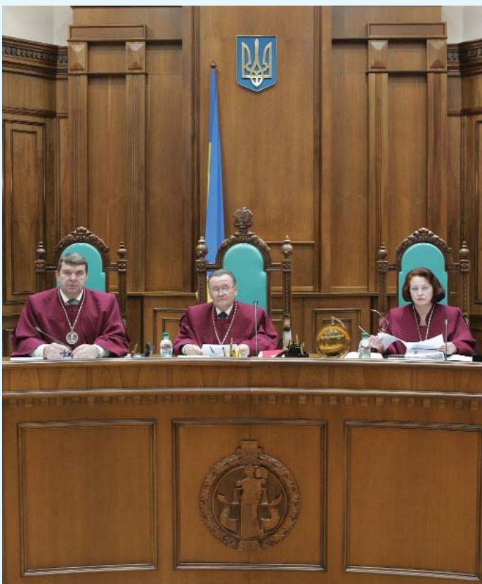
Голова Конституційного Суду України Домбровський І.П., його заступники — Пшеничний В.Г., Станік С.Р.

Якщо говорити про діяльність Конституційного Суду України протягом минулого десятиліття, то не можна не згадати, що вона відбувалася в умовах здійснення в країні реформ, пов'язаних зі складними, суперечливими явищами і процесами в її політичному, економічному, соціальному, культурному житті. З перших кроків свого функціонування Суд виступив на захист чинного конституційно-правового поля, обґрунтовував у своїх рішеннях і висновках засади здійснення державної влади в Україні, необхідність додержання Конституції органами державної вла-